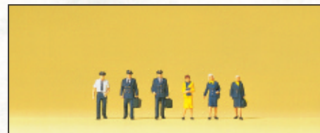
80912 Piloten, Stewardessen □ Civil airline personnel