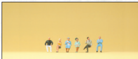
80906 Sitzende Personen □ Seated persons