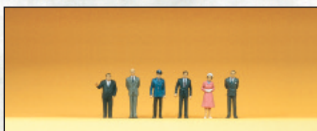
80905 Passanten □ Passers-by