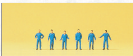
80909 Monteure □ Mechanics