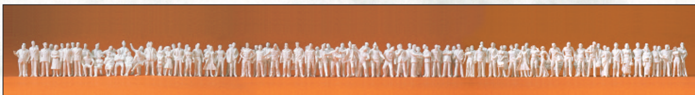
80990 190 unbemalte Miniaturfiguren. Bausatz. Figuren: Materialfarbe weiß □ 190 unpainted miniature figures. Kit. Figures: Material in white colour

Miniaturfiguren. Maßstab 1:100. Für den Architekturmodellbau. Aus Kunststoff. Unbemalt. Miniature figures. 1/100 scale. For architectural modelling. Made of plastic. Unpainted.