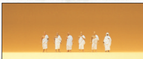
80903 Mekka-Pilger □ Mecca pilgrims