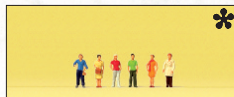
80915 Stehende Frauen □ Standing women

Miniaturfiguren. Maßstab 1:100. Für den Architekturmodellbau. Aus Kunststoff. Unbemalt. Miniature figures. 1/100 scale. For architectural modelling. Made of plastic. Unpainted.