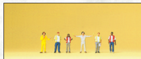
80914 Bodenpersonal □ Airport personnel