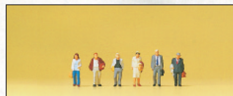
80913 Flugreisende □ Travellers