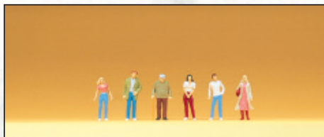
80900 Passanten □ Passers-by