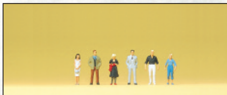
80907 Passanten □ Passers-by