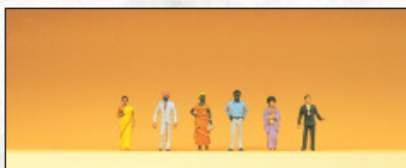
80902 Außereuropäische Reisende □ Foreign visitors