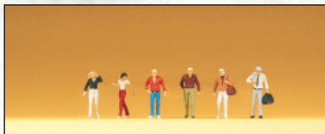
80901 Gehende Passanten □ Walking passers-by