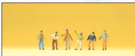
80908 Arbeiter □ Workers