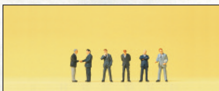
80910 Geschäftsleute □ Businessmen